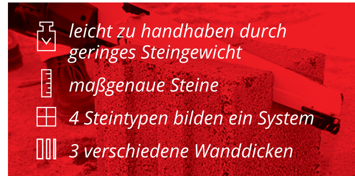
Kompakt. Das System.