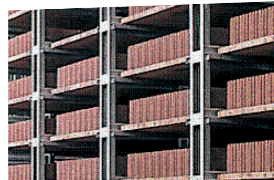
Wandbausteinproduktion aus „Liapor“