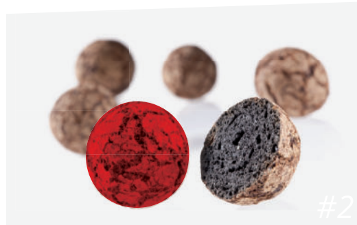
Veredelung des Lias-Ton zu „Liapor“