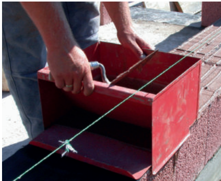
Dünnbettvermörtelung / LIAPLAN®-Mörtelschlitten